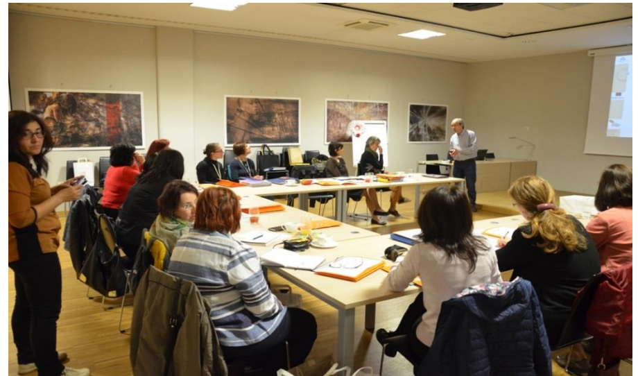
Sestanek projektne skupine v Kranju