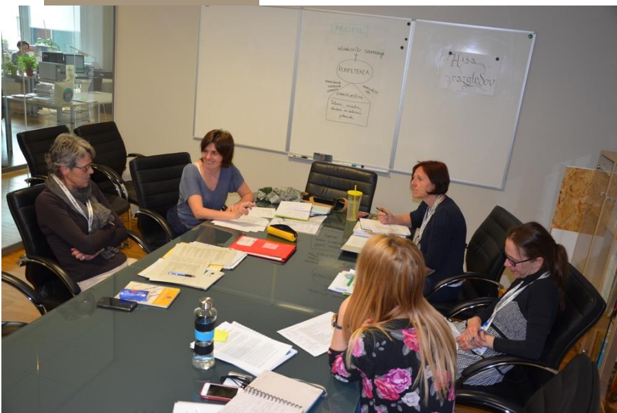
Slovenska ekipa v projektu

Pridobljeno znanje in spretnosti ter razvite sposobnosti posamezniku omogočajo uspešno in ustvarjalno osebno rast ter odgovorno delovanje v poklicnem in družbenem življenju.