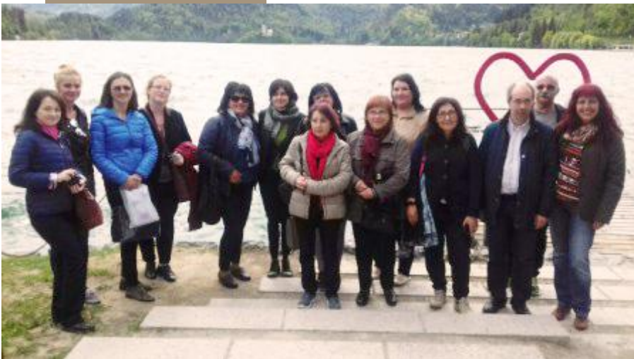
Člani mednarodne projektne skupine