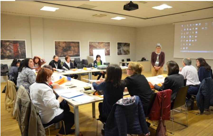
Sestanek projektne skupine v Kranju