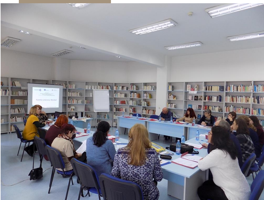
Uvodni sestanek v Romuniji

Raziskave in praktične izkušnje v različnih okoljih so pokazale, da izobraževalni programi družinske pismenosti učinkovito vplivajo na pismenost vseh generacij znotraj družine. Koncept programov družinske pismenosti temelji na tem, da se z izboljšanjem ravni pismenosti staršev ustvarjajo možnosti za doseganje boljše ravni pismenosti njihovih otrok.